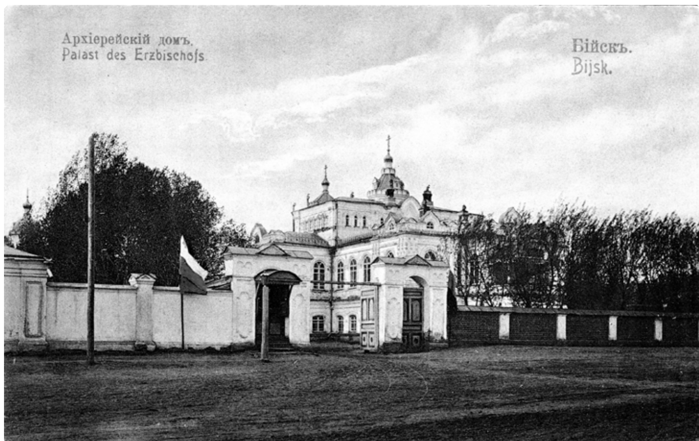
Бийский архиерейский дом. Почтовая карточка. Начало 1910-х гг.

В основу архитектурной планировки архиерейского дома были положены принципы