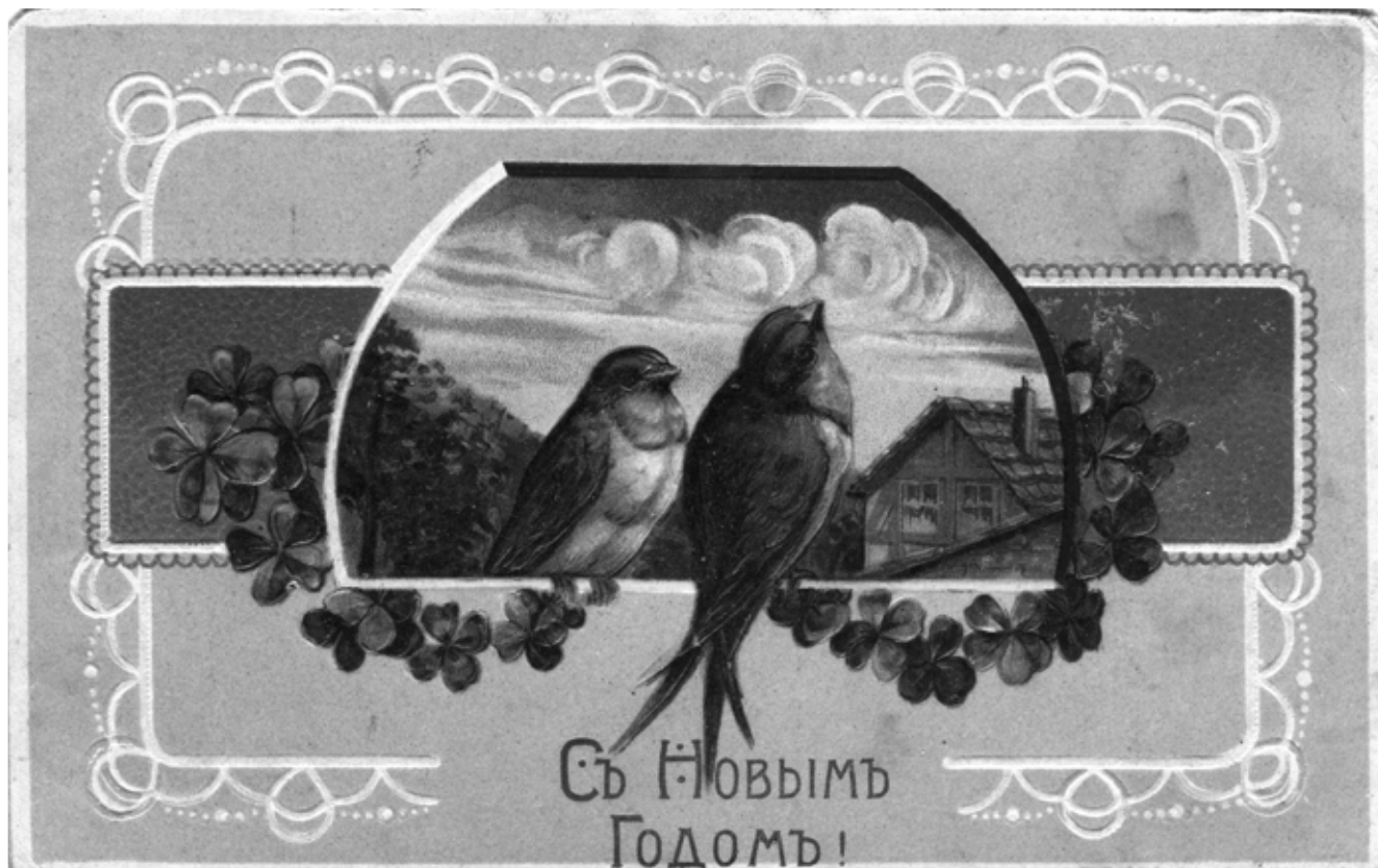
Открытка «С Новым годом!» Начало XX в. МАДМ