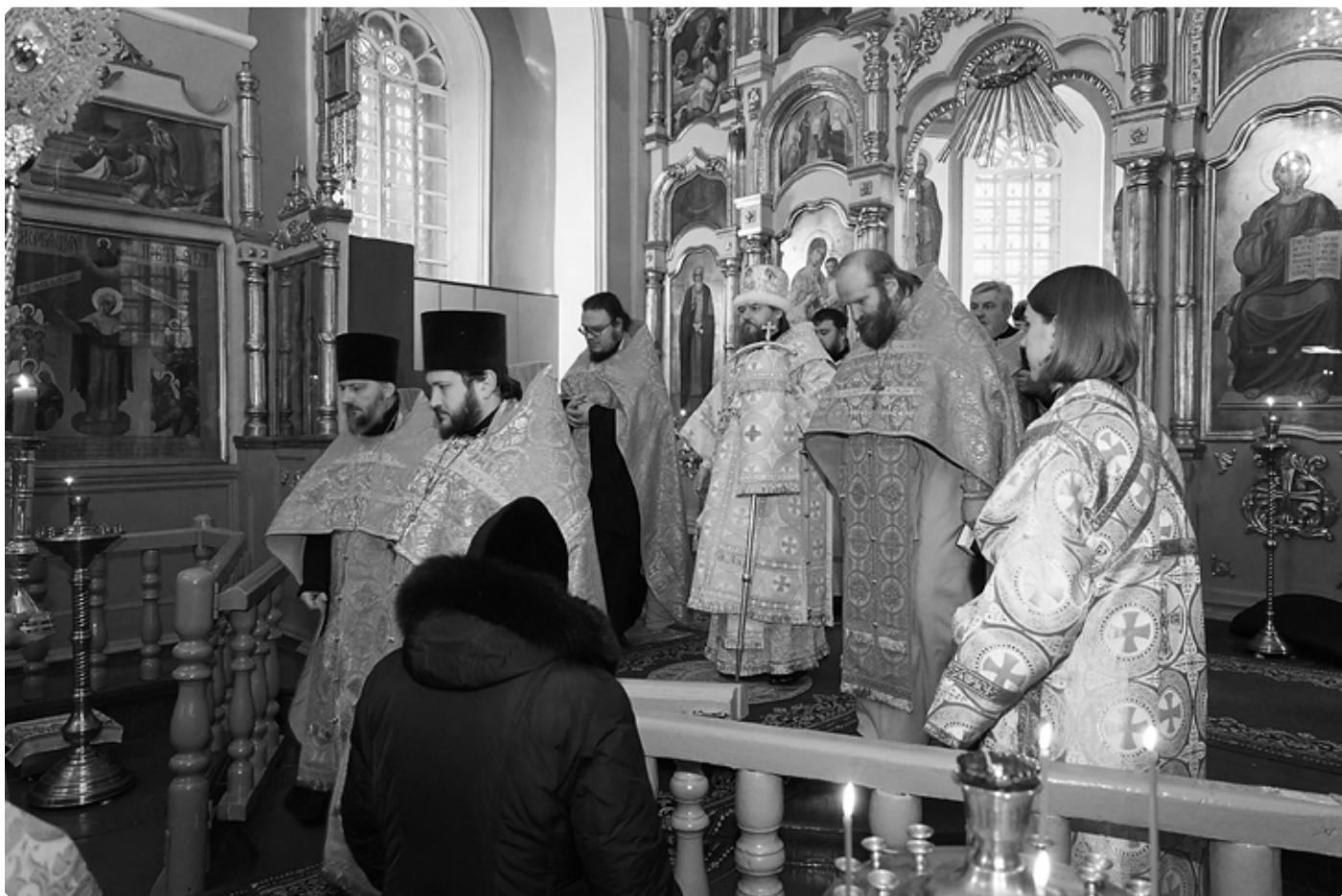
Молебен в канун Нового года в Успенском кафедральном соборе города Бийска. 31 декабря 2020 г.