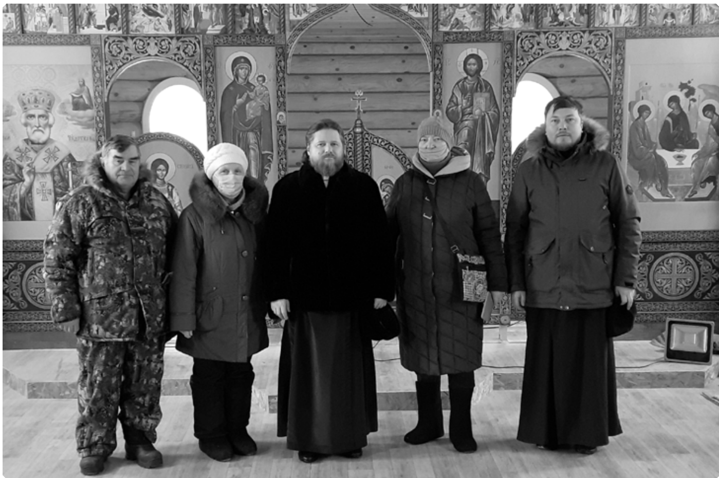
Епископ Бийский Серафим в строящемся Свято-Троицком храме села Верх-Ануйского. 31 декабря 2020 г.