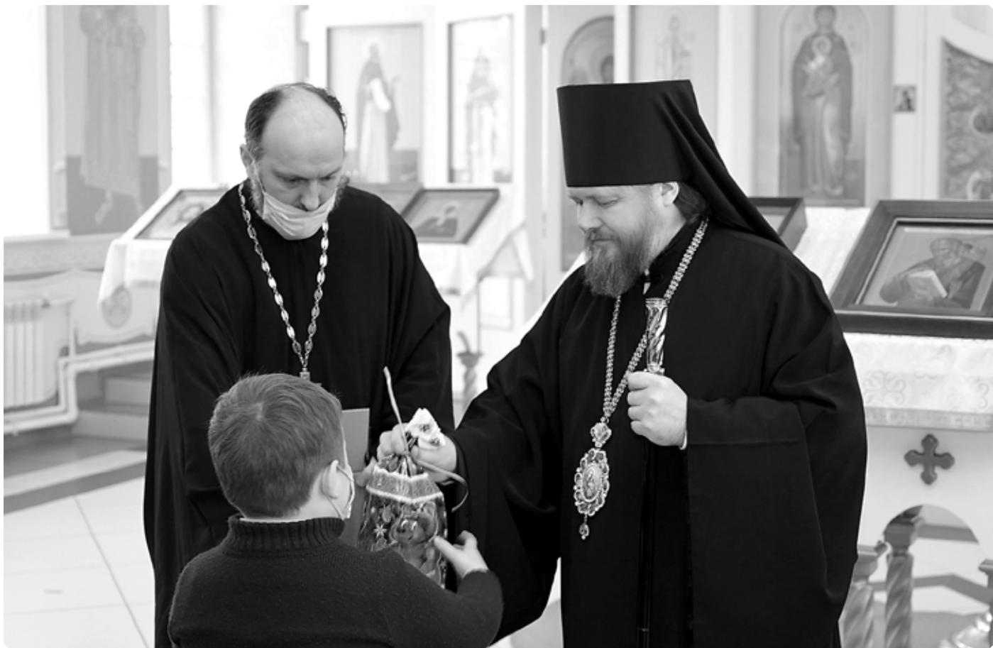
Вручение подарков учащимся православной школы города Бийска. 30 декабря 2020 г.