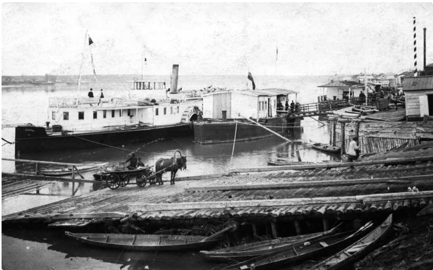
Река Бия. Бийская пристань. 1913 г. БКМ

было так. Субботин с произнесением слов: “Во имя Отца”, – погрузился в воду, обернулся около себя, поднялся из воды с произнесением слова “Аминь”. Второе погружение, с произнесением “и Сына, Аминь”, третье – “и Святого Духа”, но, поднимаясь из воды, Субботин попал под плоты и прокричал вместо “Аминь” – “караул”, и был спасен пловцами в лодках рабочими с Морозовской фабрики. Так как вместо “Аминь” Субботин прокричал “караул”, то многие самокресты не признают субботинского крещения истинным и не находятся с ним в общении...» (Из отчета о поездках епархиального отца-миссионера в 1910 г. – ред.)