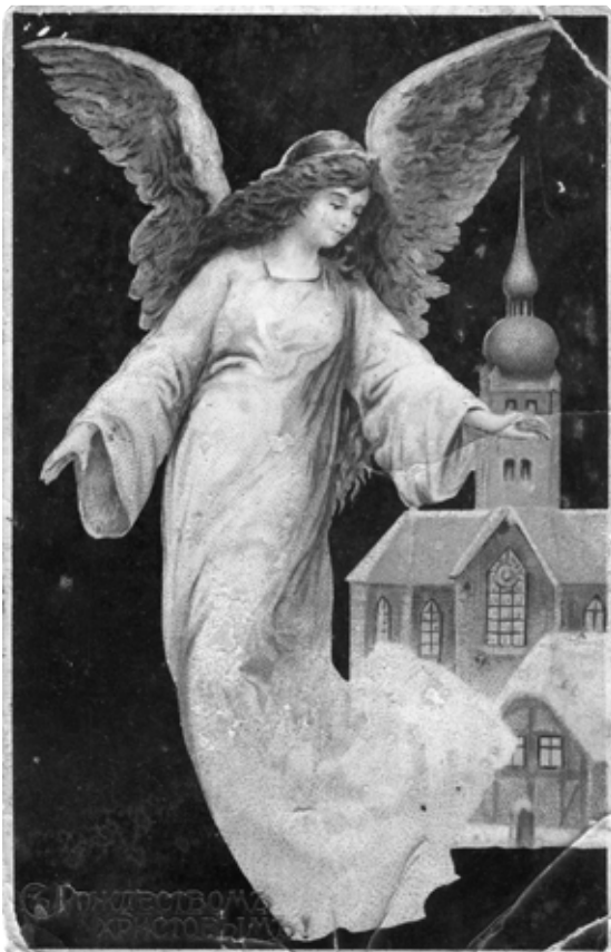
Открытка «С Рождеством Христовым!» Начало XX в. МАДМ

Рождество Христово – первый двенадцатый праздник наступившего года. Традиция поздравлять родных и близких с этим замечательным событием имеет многовековые традиции. Но сегодня для поздравлений мы пользуемся СМС-сообщениями и всё чаще готовыми, написанными за нас, с красочными «гифками» и видео.