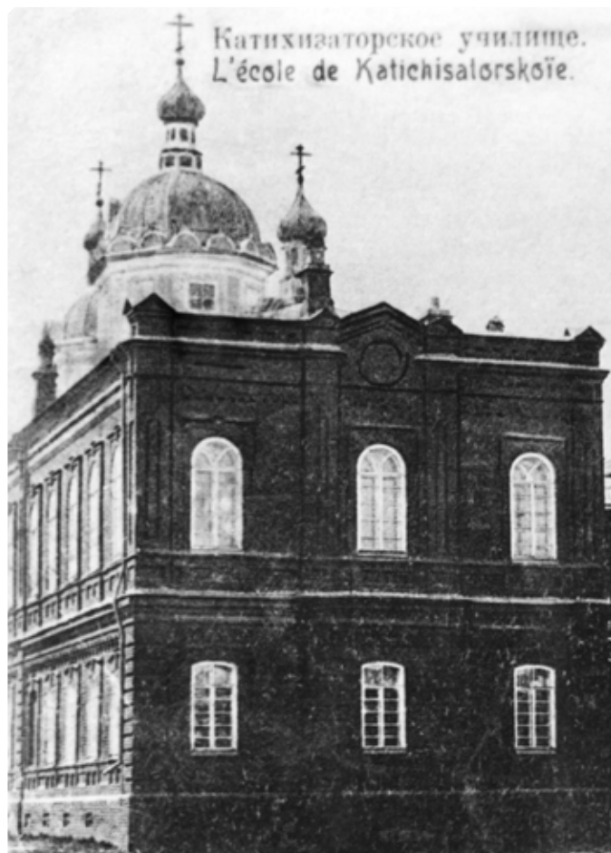
Катехизаторское училище. Почтовая открытка. Фрагмент. Начало XX в. г. Бийск. МАДМ

В ней говорится: «...Елка была устроена 2-го и 3-го января в здании катехизаторского училища. Отцом протоиереем Ивановским, заведующим катехизаторским училищем, было предоставлено для устройства елки 7 больших комнат, 2 коридора, столовая, кипятик для чая и посуда.