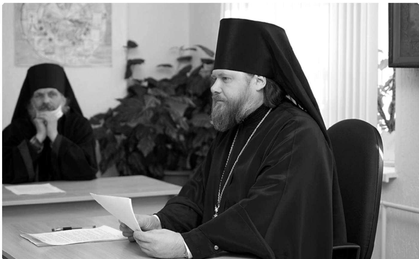
Преосвященнейший Серафим, епископ Бийский и Белокурихинский. Епархиальное собрание. 28 декабря 2020 г.

26 декабря 2020 года, накануне 29-й Недели